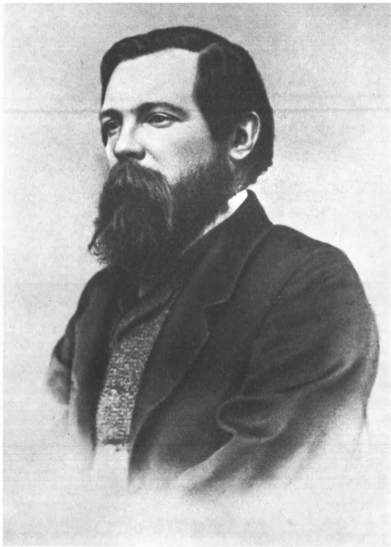
Ф. ЭНГЕЛЬС (1856)