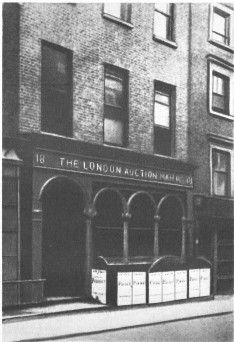
Дом на Грик-стрит в Лондоне, в котором проходили заседания Генерального Совета с 1864 по 1866 год